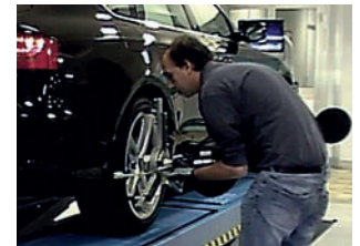
3 PONTOS + BLOQUEIO RÁPIDO