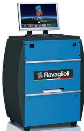
RT 011 TFT 22"

INCLUI CONSOLA RT 009 TFT 19" (COM COMPUTADOR, COMANDO À DISTÂNCIA E IMPRESSORA), TESTE DE SUSPENSÃO RT 202, TESTE DE TRAVÕES RT 102/5N, PLATAFORMA DE CONVERGÊNCIA RT 320IN E KIT DE COBERTURA DE ROLOS SRT 046L.