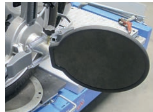
3DT® TARGET (SOLID VISION TECHNOLOGY)